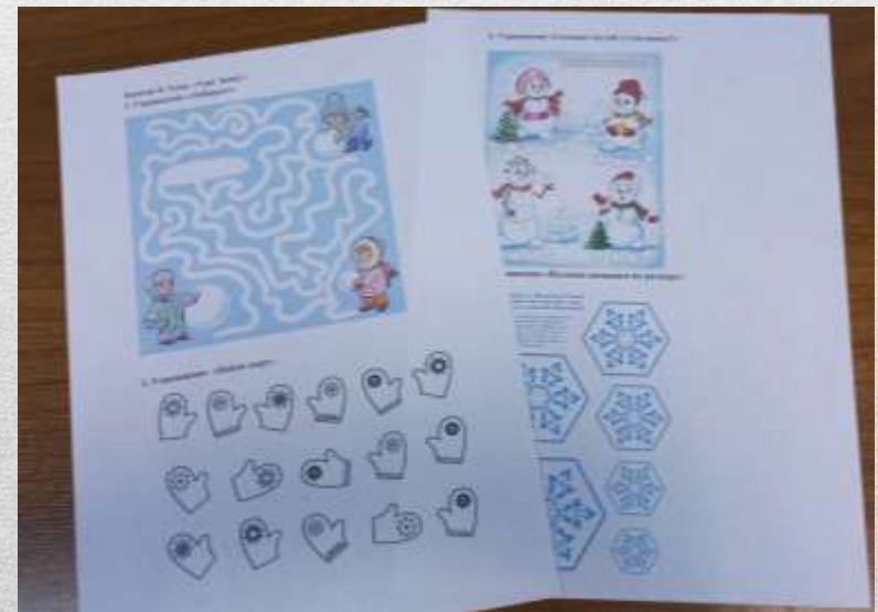
Занятие в старшей группе «Ура! Каникулы!»