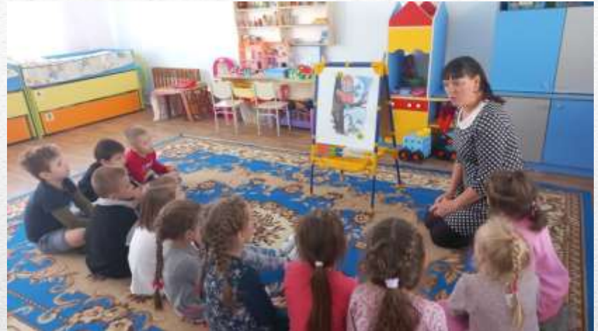
Гварждец М.Ю. на ГМО по старшему возрасту