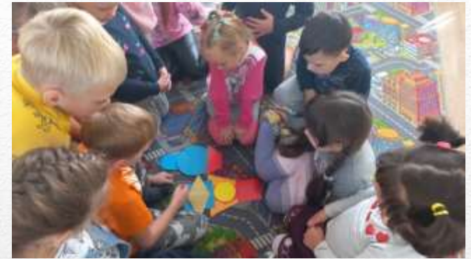
Занятие в подготовительной группе «В зоопарке»