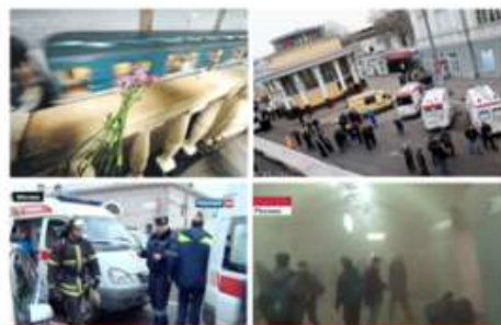
ВЗРЫВЫ НА СТАНЦИЯХ МЕТРО "ЛУБИАНКА" и "ПАРК КУЛЬТУРЫ"

Не спешите сразу уйти домой. Сначала свяжитесь с врачами. Врачи помогут выйти из шока и, если нужно, предоставят необходимое лечение. Помните: после того, как вас спасли, вам необходима медицинская помощь.